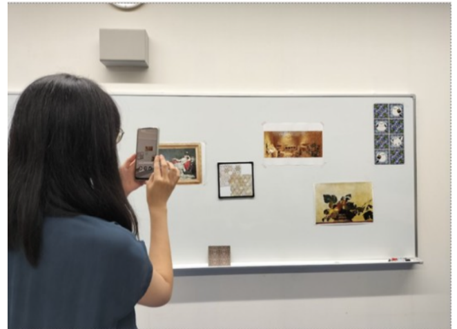
図2 ポスター周辺に AR を設定する様子

ンの周りをカメラに向けてください」と操作方法が表示されるので、デバイスのカメラで AR 表示位置の周辺情報を認識させる。この操作は進行状況がパーセントで表示されるため、100%になるまで行う。最後に「アンカーの作成が完了しました」と表示されたら設定完了である。