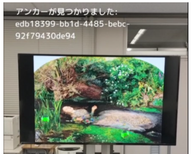
図3 緑色のモニター周辺に AR を設定した様子

現状のシステムの問題としては、第一には AR 機能の起動や AR 表示位置のデータの読み込みに時間がかかることが挙げられる。まず「設定モード」起動時にシステムが平面検知するまでの時間