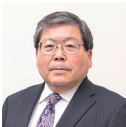
東京都立産業技術大学院大学 学長